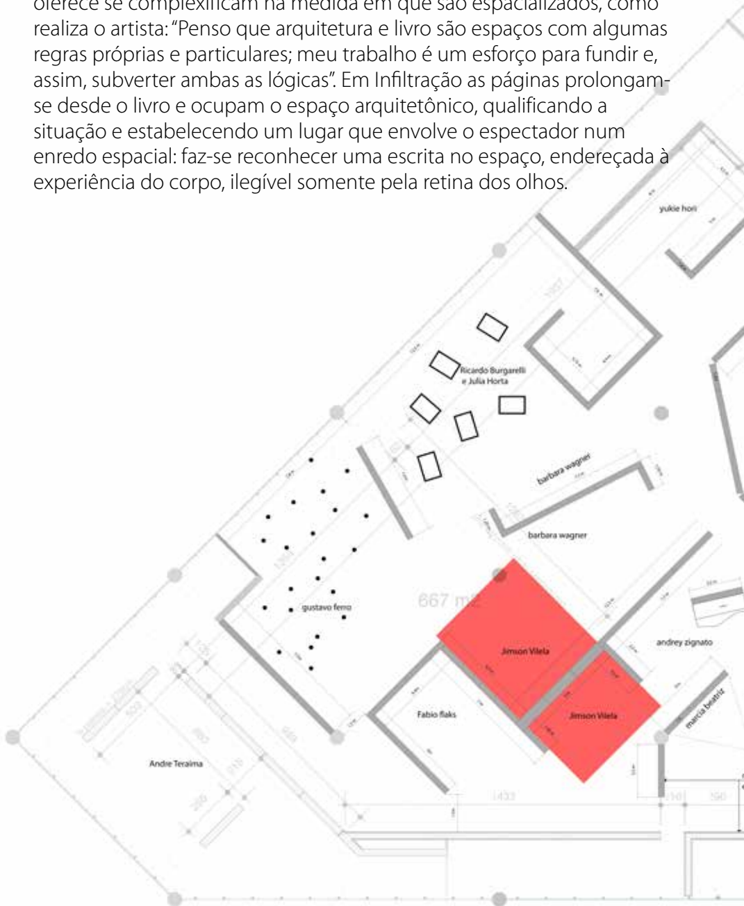
PLANTA GERAL - escala 1_50

do dedo indicador, e da distância horizontal entre a base do polegar e o outro extremo da palma da mão foram definidas as medidas das páginas. O livro e esta qualidade de acesso imediato que a página oferece se complexificam na medida em que são espacializados, como realiza o artista: “Penso que arquitetura e livro são espaços com algumas regras próprias e particulares; meu trabalho é um esforço para fundir e, assim, subverter ambas as lógicas”. Em Infiltração as páginas prolongam-se desde o livro e ocupam o espaço arquitetônico, qualificando a situação e estabelecendo um lugar que envolve o espectador num enredo espacial: faz-se reconhecer uma escrita no espaço, endereçada à experiência do corpo, ilegível somente pela retina dos olhos.